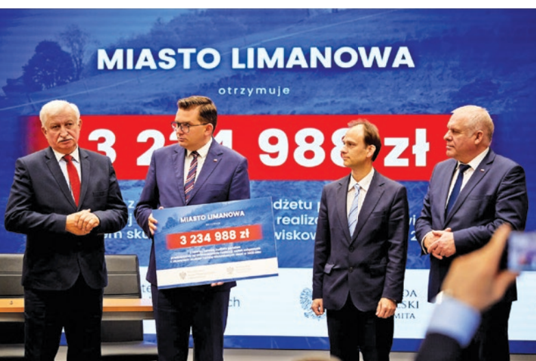
Promesa na stabilizację osuwisk odebrana – str. 4