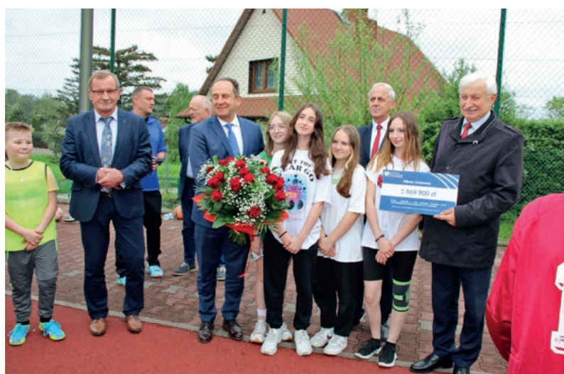
Boisko przy SP Nr 2 zostanie zadaszone – str. 5