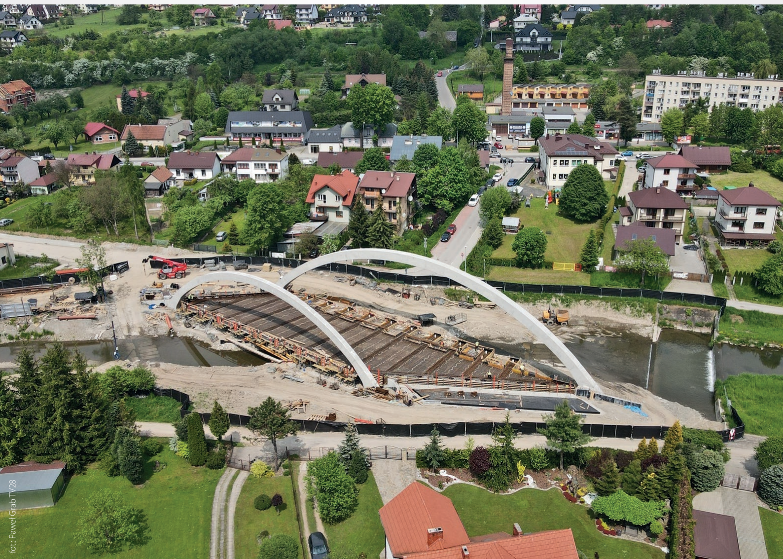
Budowa mostu w ciągu ulicy Lipowej – prace postępują str. 6