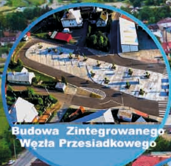
Budowa Zintegrowanego Węzła Przesiadkowego