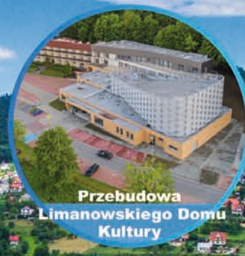
Przebudowa Limanowskiego Domu Kultury