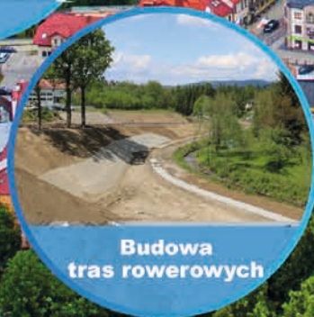
Budowa tras rowerowych