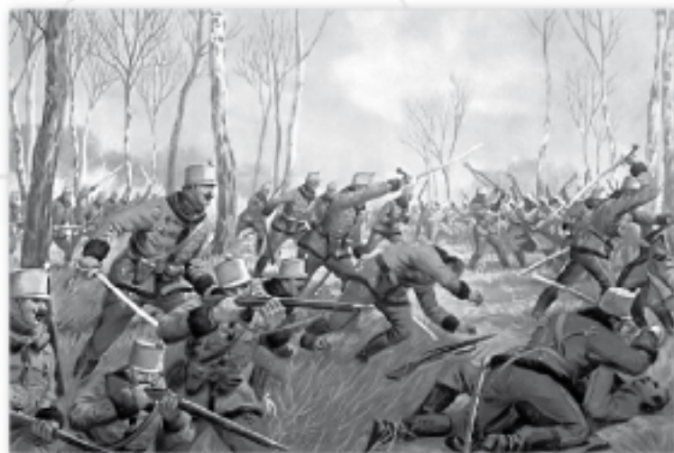
Walka 9-tego i 13-tego Pułku Huzarów pod Limanową