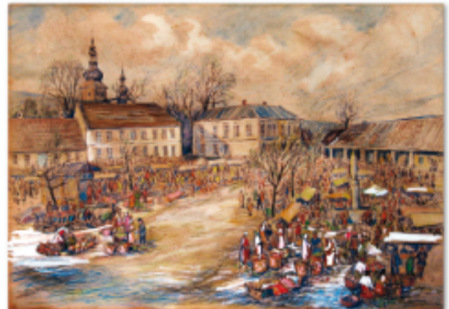
Rynek w Limanowej około 1900 roku. Malował Tadeusz Ociepka, ze zbiorów Muzeum Regionalnego Ziemi Limanowskiej

Znaczenie bitwy limanowskiej dla mieszkańców Limanowej i okolic miał charakter zarówno narodowy, jak i religijny. Wyrazem tego jest funkcjonująca po dzień dzisiejszy legenda o interwencji cudownej piety Matki Boskiej Bolesnej z Limanowej, która podczas bitwy limanowskiej miała osłonić miasto swoim płaszczem, przed ostrzałem. Wznoszony wówczas nowy kościół parafialny z niedokończoną wieżą był celem dla rosyjskich artylerzystów. Działa rosyjskie ustawiono na Golcowie w kierunku kościoła. Choć spłonęły plebańskie stajnie i kilkanaście zabudowań mieszczkańskich, sam kościół pozostał nietknięty. Po przegranej bitwie jeńcy rosyjscy biorący udział w ostrzelaniu kościoła twierdzili, że w świątynię nie mogli trafić, gdyż jakaś panienska zasłoniła go płaszczem i kierowała kulami, które mijały cel.