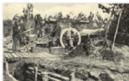
Działo forteczne na pozycji

Sprawami wojskowymi zarządzało Ministerstwo Wojny (Reichskriegsministerium), na czele z Ministrem Wojny w randze co najmniej generalskiej. Ministerstwu temu podlegało 16 okręgów Komend Korpusów (Korpskommando). W ramach okręgu dokonywano jednocześnie poboru dla potrzeb stacjonujących tam jednostek. Do tego powoływane były Okręgowe Komendy Uzupelnień, których siedziby i zasięg działania pokrywały się z jednostkami administracyjnymi. Najniższy szczebel terytorialnej organizacji wojska stanowiło 114 wojskowych okręgów uzupełnień. Spośród nich 102 były podporządkowane pułkom piechoty armii wspólnej, 4 należały do jednostek bośniacko-hercegowińskich, pułków tyrolskich strzelców cesarskich, marynarki wojennej. Pułki piechoty obu obron krajowych miały własne okręgi uzupełnień, niepokrywające się z okręgami armii wspólnej. Przed samą wojną było 37 okręgów uzupełnień landwery i 32 okręgi honwendu.