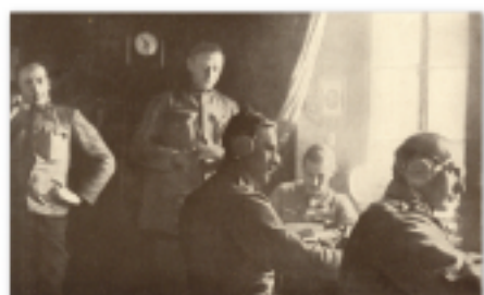
Centrala telefoniczna w austriackim sztabie

W przeddzień Wielkiej Wojny Austro-Węgry dysponowały nowoczesną armią. Zwierzchnikiem i naczelnym wodzem armii austro-węgierskiej był cesarz. Mógł przekazać swoje uprawnienia określonej osobie. Franciszek Józef I mianował na to stanowisko arcyksięcia Fryderyka Habsburga. Cesarz jako zwierzchnik sił zbrojnych miał do dyspozycji 2 generalnych adiutantów w randze generalskiej, 5 fligeladiutantów w randze oficerów starszych oraz 2 oficerów ordynasowych. Następną osobą w hierarchii wojskowej był Szef Sztabu Generalnego, który w czasie wojny pełnił obowiązki szefa sztabu Naczelnej Komendy Armii (Aremeeoberkommando). Szczególną pozycję w oficjalnej hierarchii armii miały gwardie przyboczne Cesarza i Króla, które zapewniały bezpieczeństwo monarsze na terenie rezydencji i w podróży.