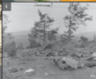
1. Józef Piłsudski | 2. Polski Legionista | 3. Wozy żołnierskie w okolicach Limanowej, 1914 r. Ze zbiorów Muzeum Regionalnego Ziemi Limanowskiej. 4. Dom i tablica upamiętniająca pobyt Józefa Piłsudskiego w Limanowej. | 5. Pobojowisko po bitwie pod Limanową - 1914 r. | Fot. w tle: Poczłtówka z polskimi legionistami, 1914 r. Ze zbiorów Muzeum Regionalnego Ziemi Limanowskiej