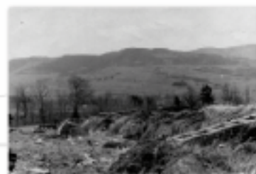
Okopy na Wzgórzu Jabłonieckim, 1914 - 1915