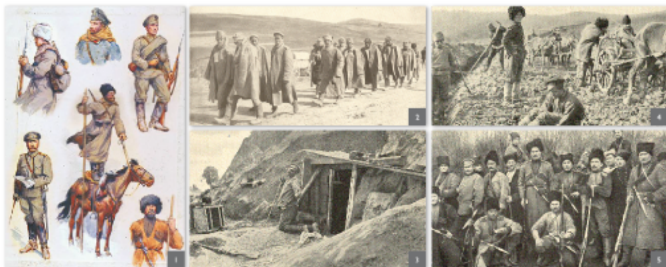
1. Ryciny przedstawiające żołnierzy rosyjskich | 2. Jeńcy rosyjscy z Armii Południowej | 3. Rosyjski okop | 4. Jeńcy rosyjscy przy pracy | 5. Żołnierze kozacy.