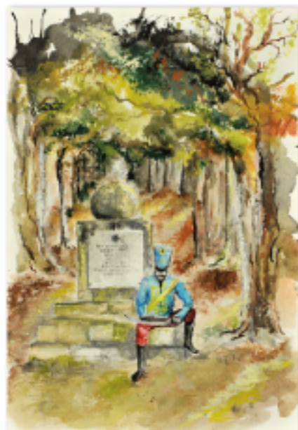
Aleksandra Rozsahegyi Gimnazjum w Miskolcu, Węgry