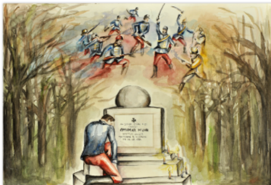
Tímea Balajti Gimnazjum w Miskolcu, Węgry