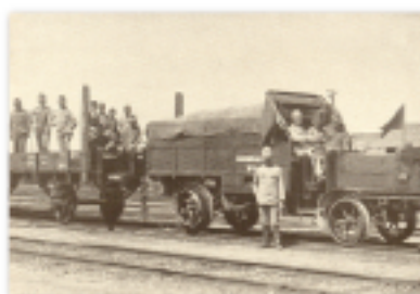
Automobil na szynach po wymianie kół na gumowe.