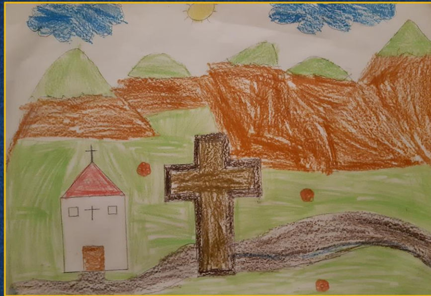
Wystawa prac plastycznych uczniów i uczennic Zespołu Szkolno- Przedszkolnego nr 4 im. Św. Jana z Kęt w Limanowej